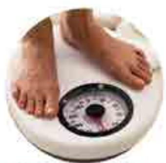
Helping with weight loss.

يزيد فرصة الانجاب لدى النساء المصابات بمتلازمة تكيس المبايض