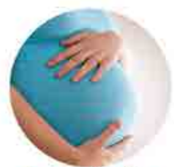
Increasing fertility in women with polycystic ovarian syndrome