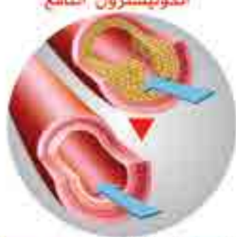
Lowering total cholesterol triglycerides and LDL Cholesterol and raising HDL cholesterol